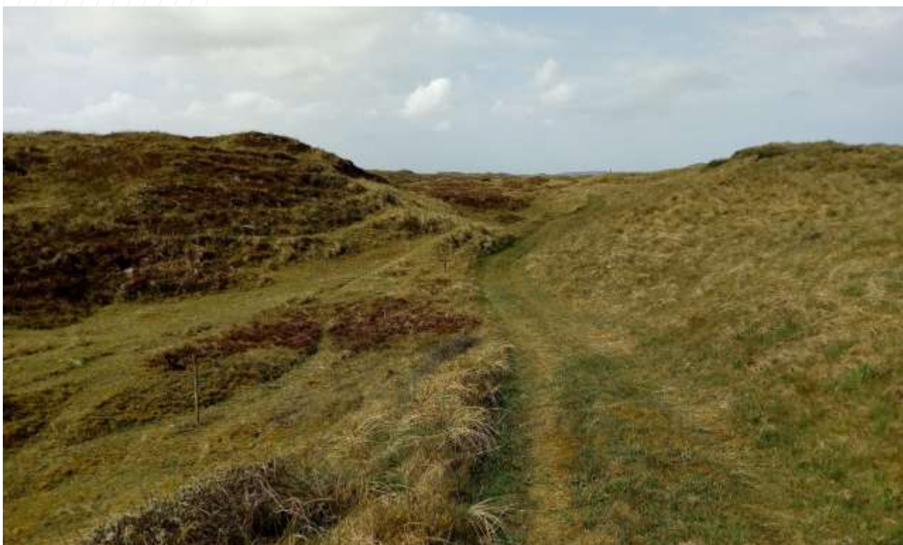
Redningsvejen/Nordsøruten ved de nedlagte rallejer i Vigsø Bugt. I denne våde vildmark trives et rigt fugle- og fugleliv.